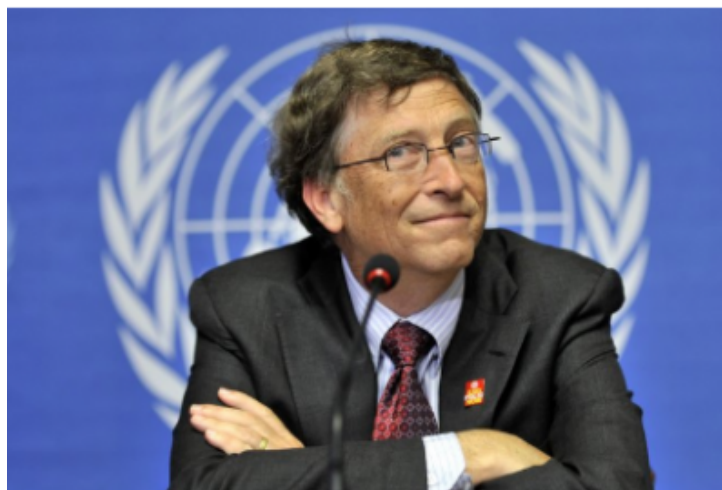
Bill Gates, cofondateur de Microsoft, intervenant devant l'OMS à Genève en 2011 pour défendre une politique de vaccins en Afrique soutenue par sa fondation.

Prenons ce dernier point. On a beaucoup, et à juste titre, critiqué l'OMS (Organisation mondiale de la santé - ndlr), sa complicité avec la Chine, la façon dont elle a tué les réussites de Taïwan dans la lutte contre la pandémie de Covid-19. Mais on s'est beaucoup moins attardé sur le fait qu'avant la Chine, Bill Gates (fondateur et principal actionnaire de Microsoft, et aujourd'hui président d'une fondation « humanitaire » - ndlr) est entré à l'OMS, profitant de sa crise financière (liée aux tergiversations des États-nations pour s'acquitter de leurs obligations financières). Bill Gates assure ainsi presque 20 % du financement de l'OMS, l'obligeant à dépenser les sommes versées pour des programmes de son choix, sur lesquels il ne rend de comptes à personne. Bill Gates a ainsi pris le contrôle d'une organisation onusienne et fait valider par elle la politique de sa fondation. Cela ne peut pas durer comme cela. Il faut sauver le soldat OMS et cela passe nécessairement par de la coopération internationale et le réengagement des États nationaux dans la coopération médicale internationale renforcée.